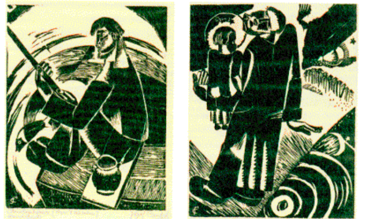
Jozef Condré: 'Christophorus: Aan 't vissen' (links) en 'Aan wal' (rechts). Copyright: 2006 Groninger Museum, Groningen

De houtdrukken van Jozef Condré maken deel uit van 'Beeld van een verzameling', de collectie van W.R.H. Koops in het Ploegenvijloen van het Groninger Museum. Open: di/t/m zo 10-7 uur. Tot 27 februari.